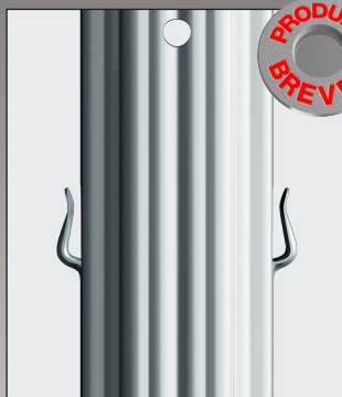
Face avant avec perçage pour pose accessoires