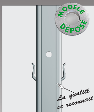
Face avant avec perçage pour pose accessoires